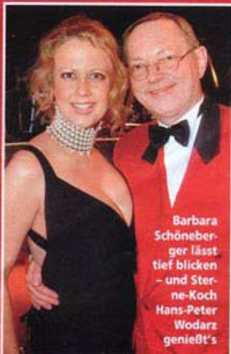
Barbara Schöneberger lässt tief blicken – und Sterne-Koch Hans-Peter Wodarz genießt's